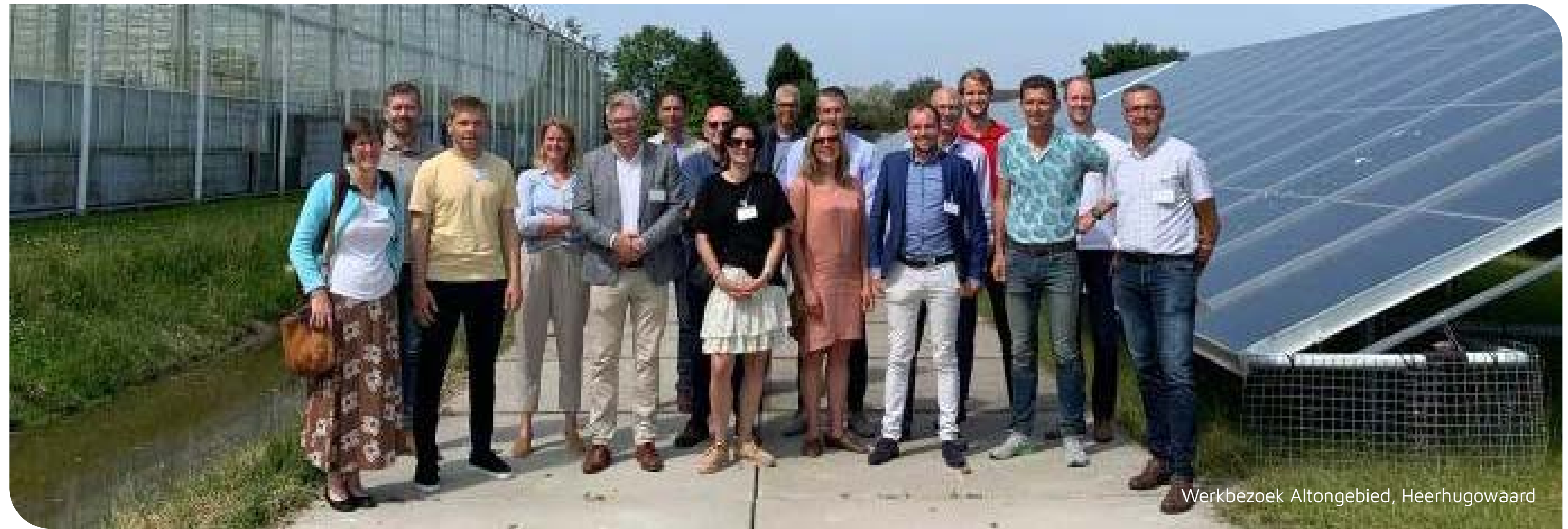
Werkbezoek Altongebied, Heerhugowaard

Na de zomer heeft de werkgroep een analyse opgeleverd inzake de verkleuring van twee tuinbouwgebieden met als doel hier leerpunten uit te halen. Als gevolg van de energiecrisis dreigen een aantal bedrijven te stoppen en/of komen glasopstanden (al dan niet tijdelijk) leeg te staan. Dit versterkt het risico op verkleuring van